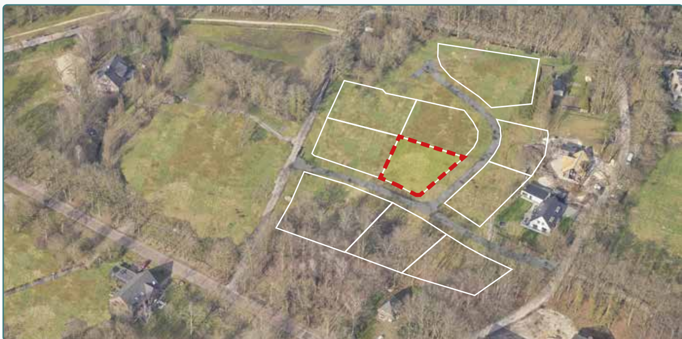
Kavel 167 vanuit de lucht