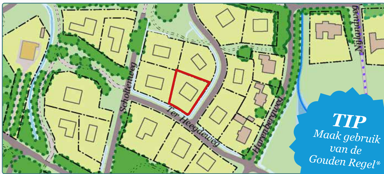
Situatietekening kavel 167